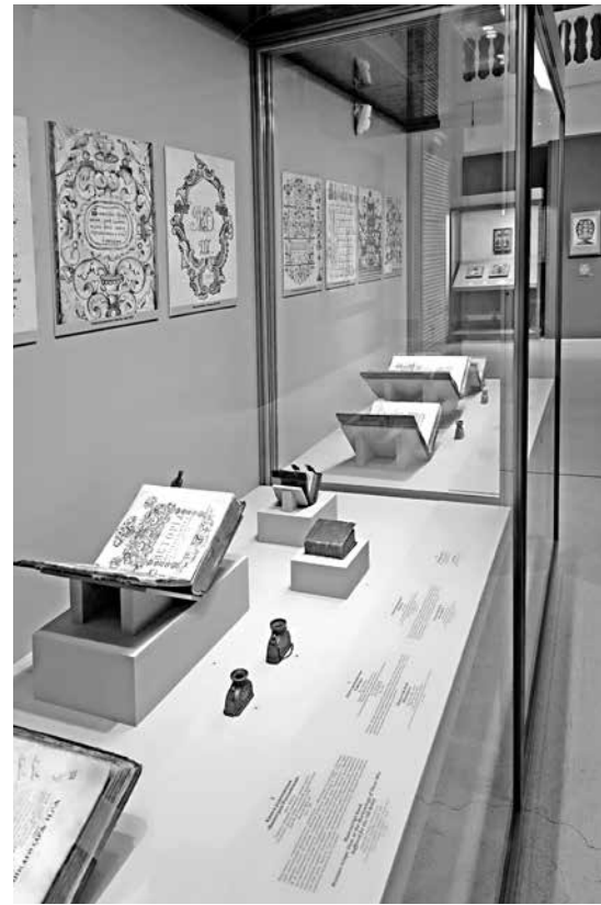
fig. 8 Pomeranian manuscripts and drawn pages of the 18 th –19 th centuries. Vyg. State Hermitage