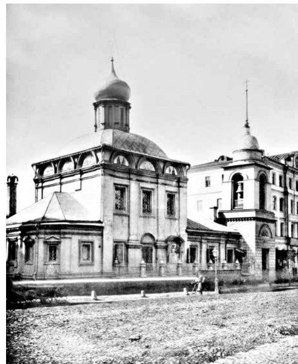
ил. 1 Храм Максима Исповедника. Москва, Китай-город, улица Варварка. начало XX в.