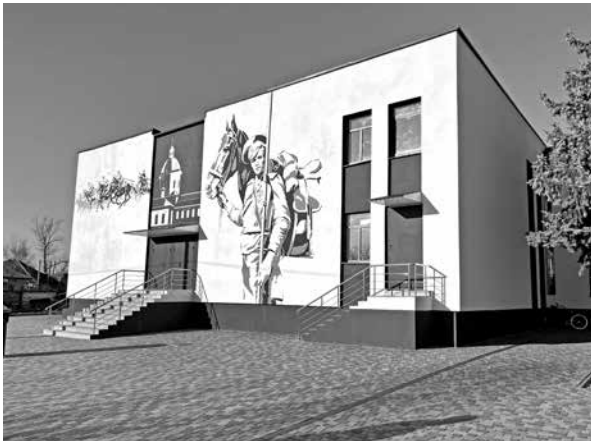
ил. 11 Здание Станично-Луганского краеведческого музея (Музей казачества) Вид после реставрационных работ

fig. 11 Building of the Lugansk Stanytsia Museum of Local Lore (Museum of the Cossacks) View after restoration.