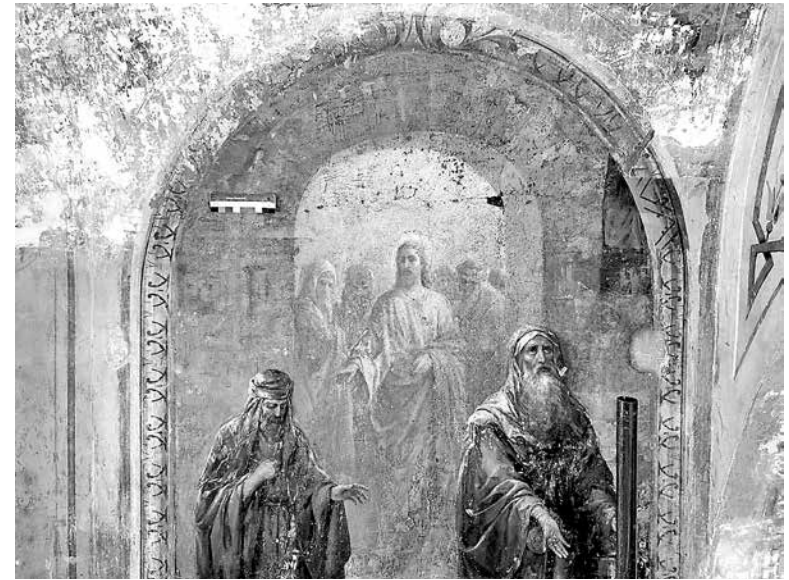
fig.8 "Lesson of the widow's mite". The lower part of the composition. Narthex of Trinity Cathedral, Troitsk (Chelyabinsk region). Painting of the late 19 th century

ил.8 «Лепта вдовицы». Нижняя часть композиции. Притвор Троицкого собора г. Троицка (Челябинская обл.). Живопись конца XIX в.