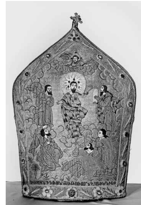
ил.1 Армянская митра. Астрахань, 1753 Преображение

fig.1 Armenian mitre. Astrakhan, 1753 Transfiguration