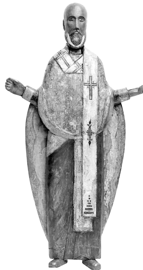
ил. 1 Никола Можайский. Скульптура, вторая четверть XVI в. ГИМ fig.1 St. Nicolas (“Mozhaisky”) Sculpture, the second quarter of the 16 th century. State Historical Museum

второй четвертью XVI столетия на основе иконографического и стилистического анализа. Однако после нашего доклада в каталоге ГИМ в статье об интересующем нас предмете появилась датировка «середина XVI в.», по-прежнему привязанная к данным о сооружении перемышльского храма.