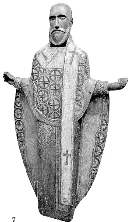
fig. 7 St. Nicolas (“Mozhaisky”) Sculpture, the second quarter — middle of the 16 th century. Tula Regional Museum of Local History