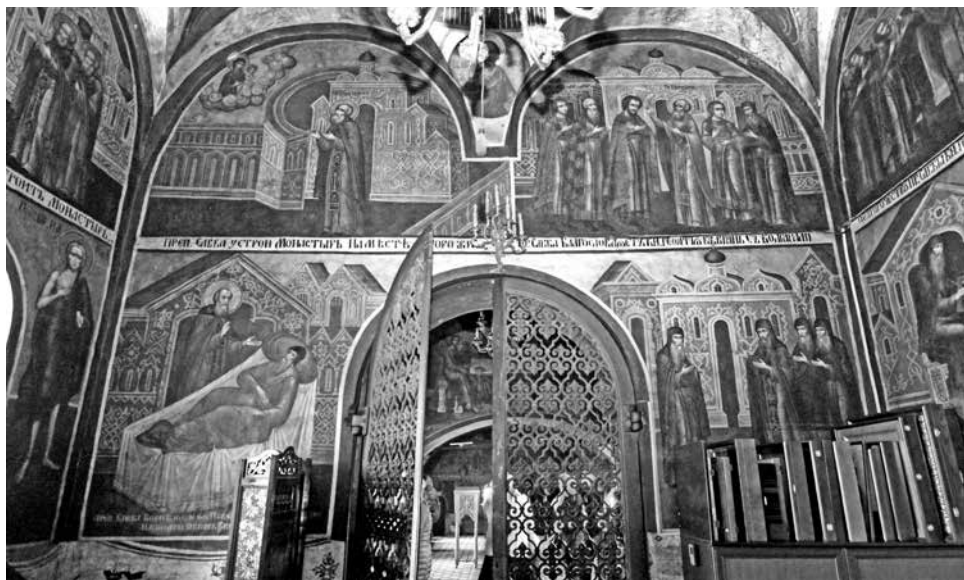
ил. 1 Роспись западной стены придела преподобного Саввы Рождественского собора Саввино-Сторожевского монастыря. 1649–1650 гг. (?), под записью 1872–1873 гг. fig. 1 The painting of the western wall of the Saint Savva's Chapel of the Nativity Cathedral at the Savvino-Storozhevsky Monastery. 1649–1650 (?), under the pictorial layer of 1872–1873

поздняя живопись, которая скрывает под собой ранний памятник и пока не привлекает внимание ученых. В научной литературе содержится крайне мало упоминаний о житийных сценах преподобного Саввы в росписи 3 . Между тем этот памятник входит в интересную и малоизученную группу стенописных программ придельных храмов и галерей, которые демонстрируют появление новых иконографических тем и связаны с особенностями богослужбной и духовной жизни русских монастырей. Главными задачами настоящего исследования являются определение круга памятников, которые могли стать образцом для росписи, рассмотрение особенностей иконографии входящих в состав цикла композиций, а также комплексный анализ позднего слоя живописи как воспроизведения программы росписи 1649–1650 гг.