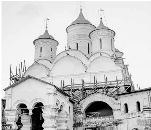
fig.4 A fragment of the western facade of the Cathedral of the Spaso-Prilutsky Monastery before restoration. The outlines of the zakomara of the first stage of construction and traces of the icon case in the central strand can be seen. Central scientific-restoration workshop. 1950