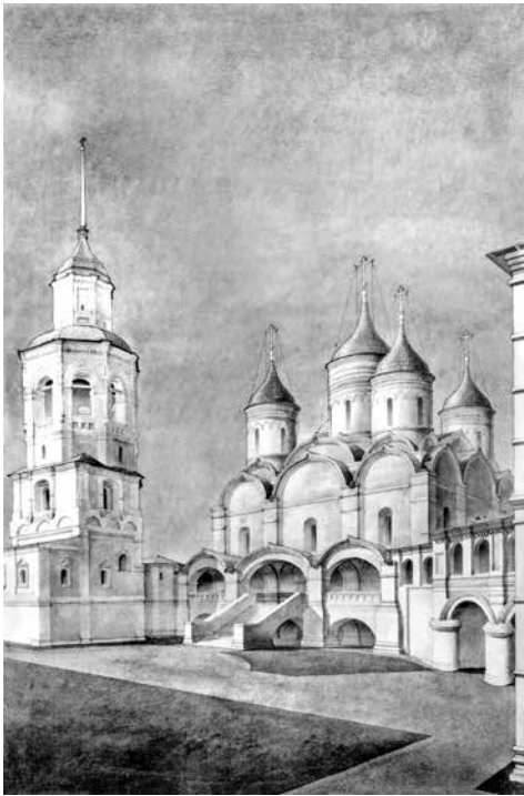
ил.6 Графическая реконструкция первоначального облика собора Спасо-Прилуцкого монастыря по версии Г.П. Белова. 1960 г.