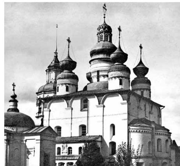
ил.1 Собор Спасо-Прилуцкого монастыря. Репродукция с фотографии начала XX в.

fig.1 Cathedral of the Spaso-Prilutsky Monastery Reproduction from a photograph of the early 20 th century