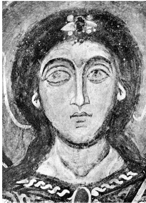
fig. 4 Evangelist Matthew. Fragment of the painting of the sails. Fresco of the Church of the Transfiguration on Nereditsa, 1199.

ил. 6 Евангелист Матфей. Фрагмент росписи парусов. Фреска церкви Спаса Преображения на Нередице, 1199 г.