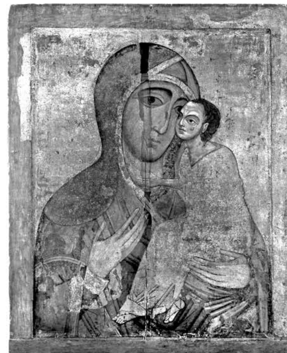
ил.1 Богоматерь Умиление (Старорусская). Икона Новгород, начало — первая четверть XIII в. ГРМ

fig.1 The Mother of God of Tenderness (Starorusskaya) Icon. Novgorod, the beginning — the first quarter of the 13 th century. State Russian Museum