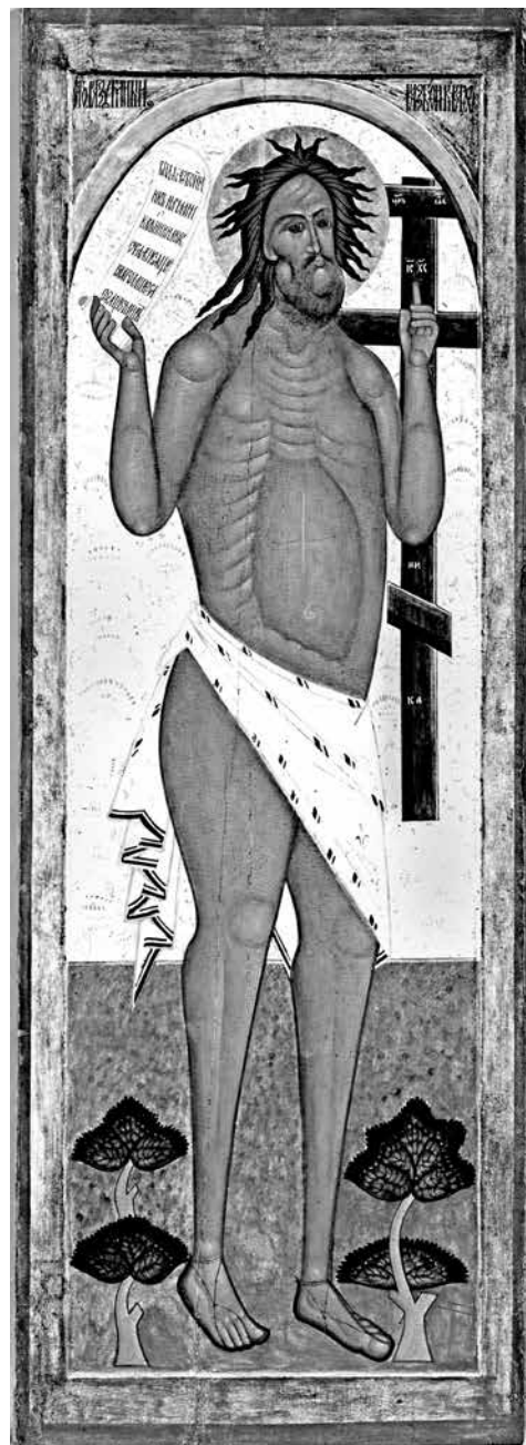
ил.1 Благоразумный разбойник. Икона из собрания Музея русской иконы имени Михаила Абрамова. Последняя треть XVI в. fig.1 The Good Thief. Icon from the collection of the Museum of the Russian Icon named after Mikhail Abramov Last third of the 16 th century

Обе иконы характеризует повышенное внимание к передаче объема и активное применение светотеневой моделировки, что особенно заметно в трактовке их скульптурных, будто высеченных из камня, гармоничных ликов. Эстетика, пестующая скульптурность и монументальность образа, отражена не только в исполнении личного, но и в попытках трехмерной передачи Крестного древа за спиной разбойника с использованием нескольких цветов для его переключений. В то же время явный интерес к выявлению объема сочетается в иконе с нарочитой стилизацией и геометризмом, доходящими порой до гротескности и маньеризма. Если в лике Разбойника повышенная экспрессия почти нивелирована, то она отчетливо проступает в общем решении его фигуры, будто расширяющейся кверху, и в контрастных пропорциях мощного торса и миниатюрных ладоней и ступней. Кажется, что он балансирует, по-