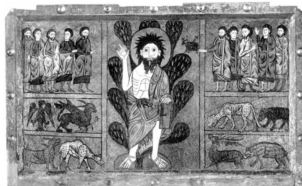
ил. 1 Иоанн Предтеча в пустыне. Алтарный антепендиум из романской церкви в Хесера в Арагоне, Испания. XIII в. Национальный музей искусства Каталонии, Барселона

fig. 1 St. John the Baptist in the Wilderness. Altar antependium from the Romanesque church at Gecera in Aragon, Spain. 13 th century. National Art Museum of Catalonia, Barcelona