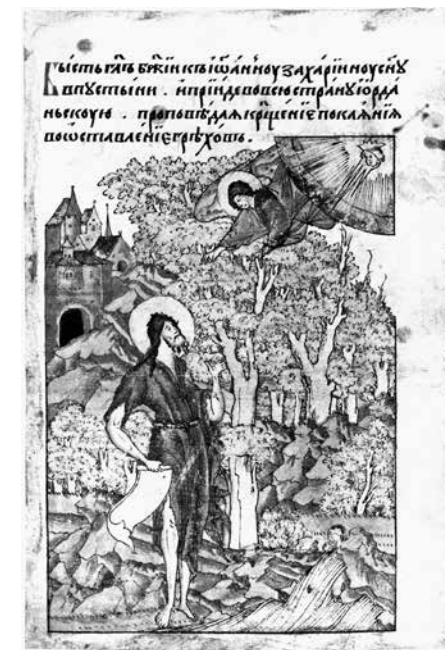
fig. 9 St. John the Baptist in the Wilderness. Icon. Last third of the 16 th century From the Chudov Monastery in the Moscow Kremlin. State Tretyakov Gallery, Moscow