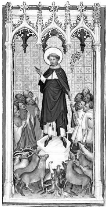
ил.7 Проповедь св. Франциска Ассизского людям и животным. Стигматизация св. Франциска. Фреска ц. Св. Катарины, Любек, Германия. 1510–1515 гг.

fig.7 Sermon of St. Francis of Assisi to people and animals. Stigmatization of St. Francis. Fresco of the Church of St. Catherine, Lübeck, Germany 1510–1515