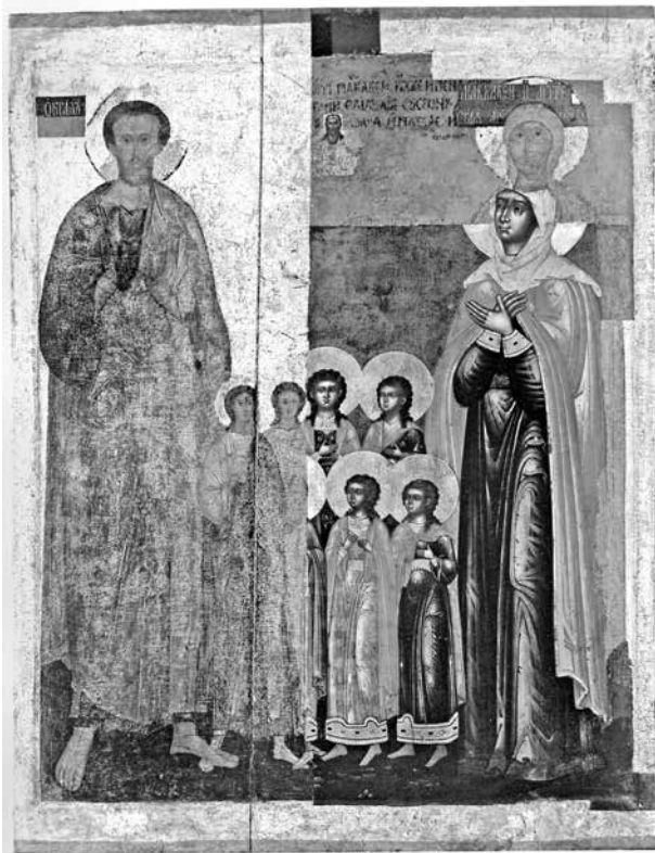
ил.1 Парная икона из церкви Происхождения честных древ Креста в Покровском монастыре Суздаля, с изображением праздников, приходящихся на 1 августа («Происхождения честных древ Животворящего Креста Господня» и «Братья Маккавеи, учитель Елеазар и их мать Соломония»). Государственный Владимиро-Суздальский музей-заповедник fig.1 Paired icon from the Church of the Origin of the Holy Trees of the Cross in the Intercession Monastery in Suzdal, depicting the holidays that fall on August 1 ("The Origin of the Holy Trees of the Life-Giving Cross of the Lord" and "The Maccabee Brothers, the teacher Eleazar and their mother Solomonia") The State History, Architecture and Art Vladimir-Suzdal Museum-Reserve