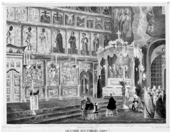
ил.7 Интерьер Троицкого собора 1865 г. Тоновая литография Сергиево-Посадский музей- заповедник