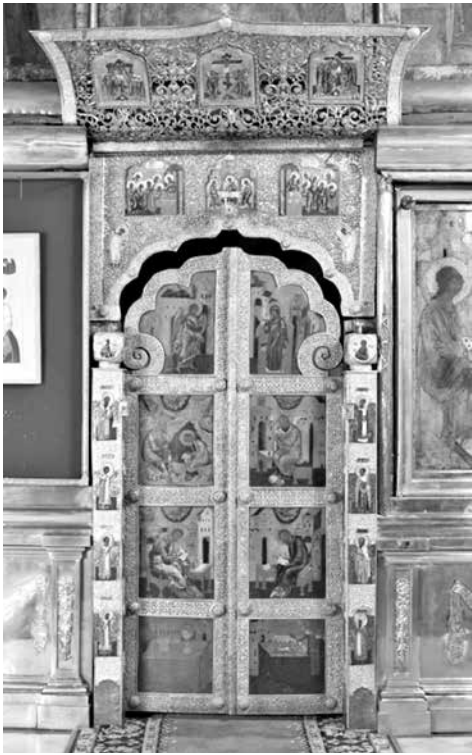
ил.3 Царские врата. Мастерские Московского Кремля. Вклад царя Михаила Фёдоровича Романова в 1643 г.