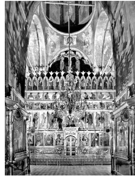
ил. 1 Иконостас Троицкого собора Троице-Сергиевой лавры fig. 1 Iconostasis of the Trinity Cathedral of the Trinity Lavra of St. Sergius

В настоящее время иконостас собора состоит из пяти рядов. В местном ряду двенадцать икон, в том числе Царские врата и две алтарные двери. Деисусный чин включает пятнадцать икон с изображениями святых и наряду с Деисусом Благовещенского собора Московского Кремля входит в число древнейших из сохранившихся с ростовыми фигурами. В праздничном ряду