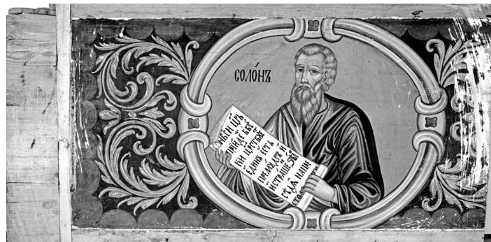
ил. 1 Солон Афинский. Новгород (?), 1719–1720 гг. Частное собрание. Без реставрационных тонировок fig. 1 Solon of Athens. Novgorod (?), 1719–1720 Private Collection. Without restoration toning

и Востока» и А.Л. Гульманова «Образы «еллинских мудрецов» в русской изобразительной традиции». Следует отметить, что подготовленный авторами материал в два-три раза превысил заданный объем издания. Одно лишь приложение с полным перечнем восточных и западных памятников с образами мудрецов составило целый авторский лист и не вошло в выставочный каталог. Эти материалы будут опубликованы отдельно.