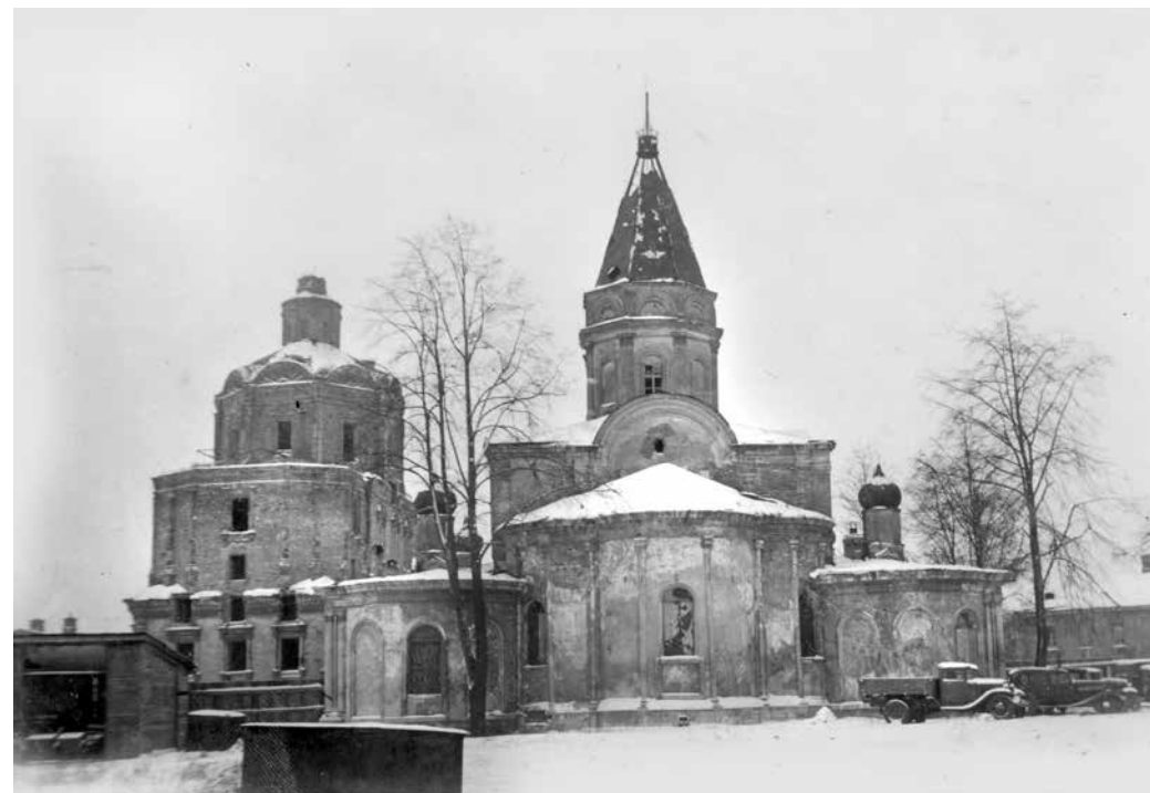
ил.4 Вид Трапезной палаты и Спасского собора с востока. 1940-е гг.

fig.4 View of the Refectory and Spassky Cathedral from the east. 1940s.