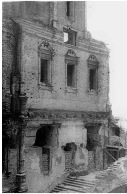
fig.2 Refectory south facade. 1940s. Shchusev Museum of Architecture, fund P XIV, inventory 9, case 64, page 14

ил.2 Трапезная палата, южный фасад. 1940-е гг. ГНИМА. Ф.Р XIV. Оп. 9. Д. 64. Л. 14