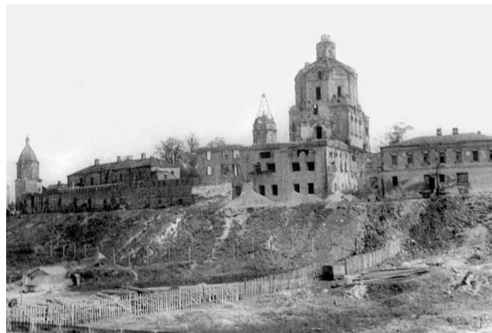
ил.1 Вид Андроникова монастыря с запада. 1940-е гг. ГНИМА. Ф.Р XIV. Оп.9. Д.64. Л.5 fig.1 View of the Andronikov Monastery from the west. 1940s. Shchusev Museum of Architecture, fund P XIV, inventory 9, case 64, page 5

В акте осмотра было отражено плачевное состояние здания палат: «находится в заброшенном состоянии... с сентября 1941 года по настоящее время ничем не прикрытые своды подвергались воздействию атмосферных осадков и находятся под угрозой обрушения... металлические связи и затяжки сводов были нарушены в результате некультурного отношения памятника и приспособления его под жилье ...» 2 Комиссией были предложены срочные противоаварийные меры по спасению памятника, которые, впрочем, не были проведены.