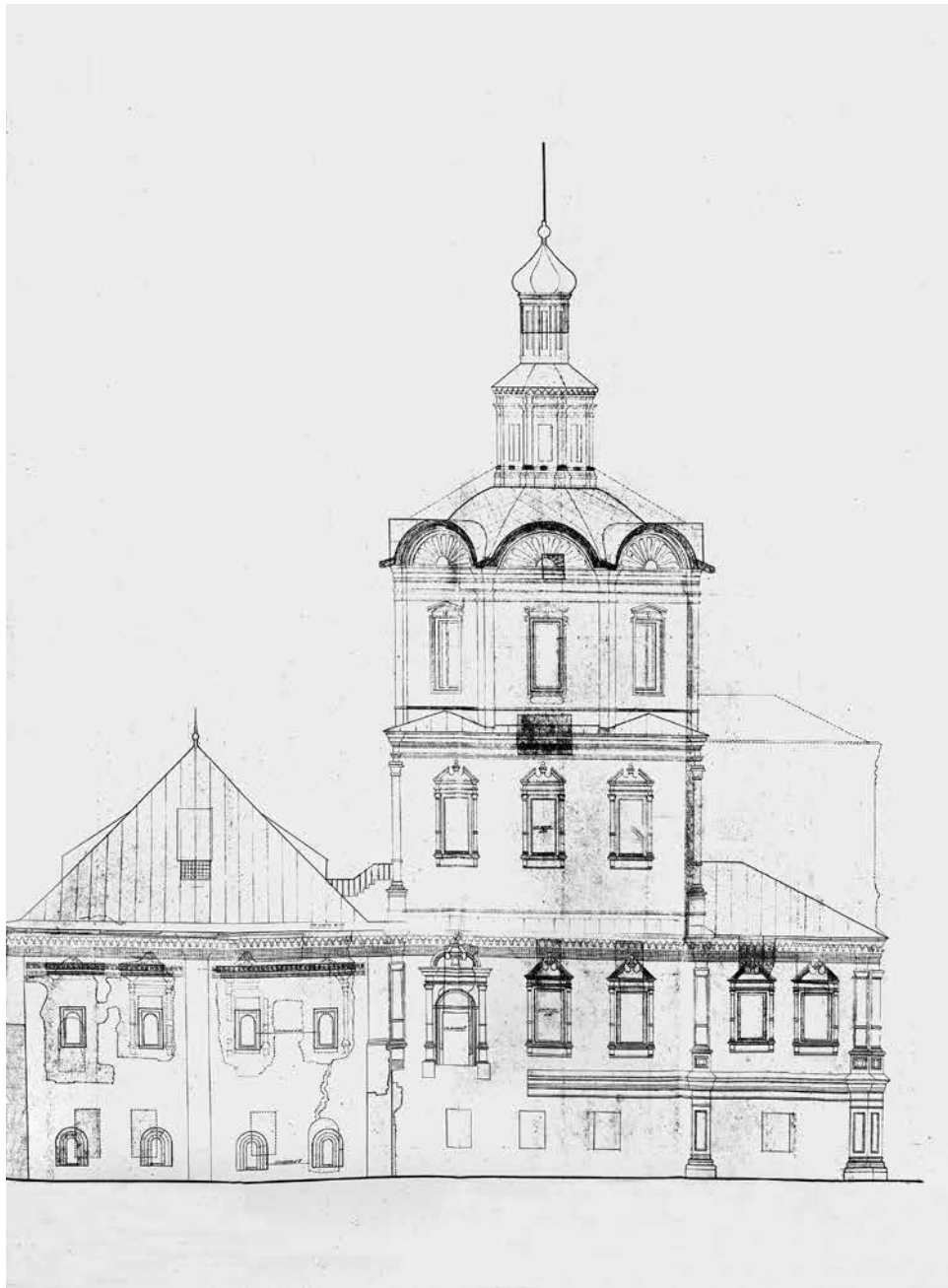
ил.5 Проект реставрации. Южный фасад с обозначением восстанавливаемых частей. 1948 г. ГНИМА. Ф. Р XIV. Оп. 9. Д. 67. Л. 4