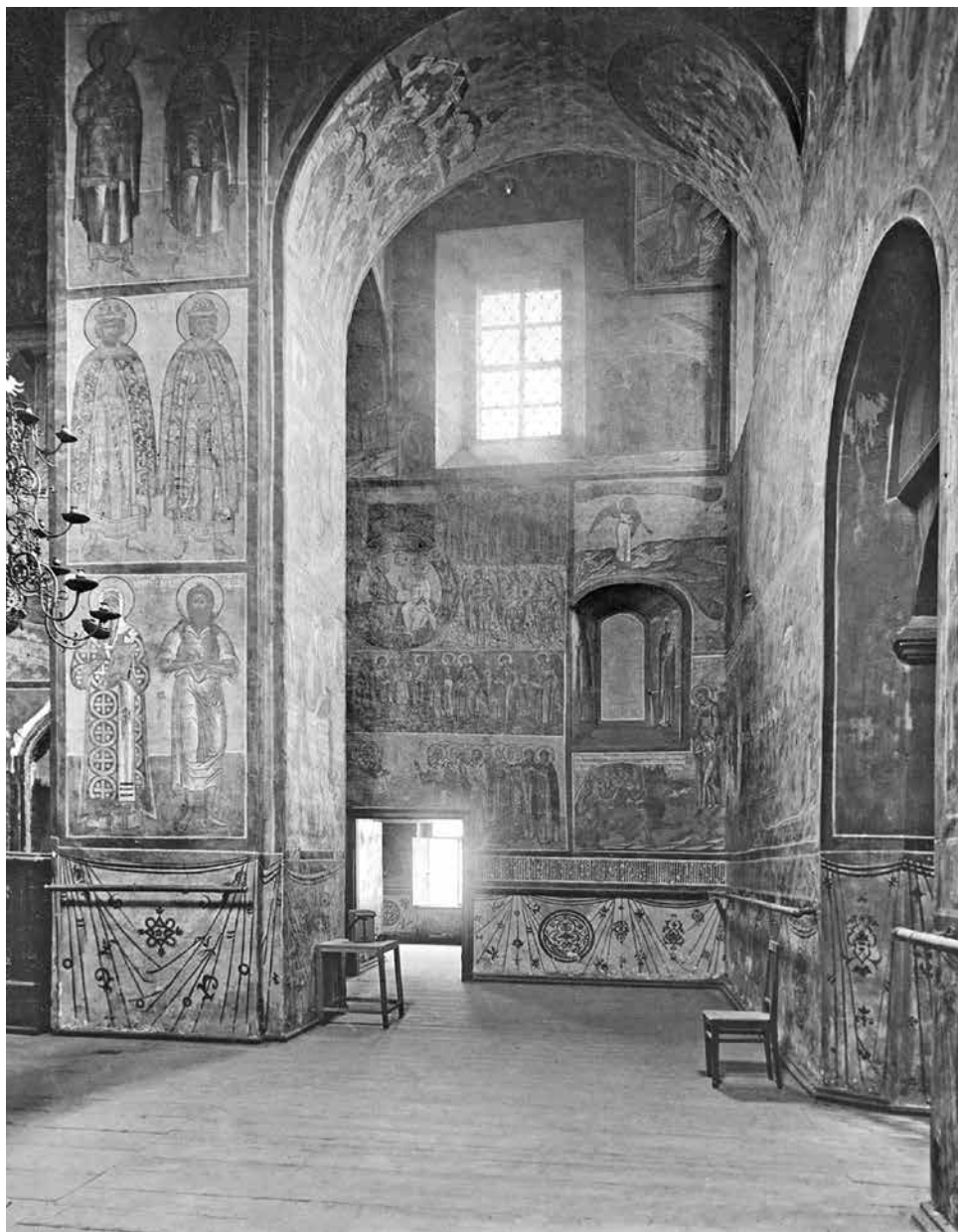
ил. 1 Интерьер собора Троицкого Макарьева Калязина монастыря. Западное пространство, вид на юг. Фотография конца 1930-х гг.