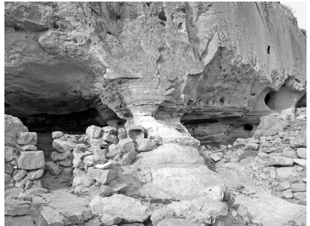
ил.4 Пещеры у села Айкадзор в Армении. 2008