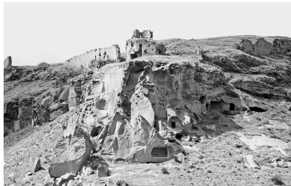
ил. 1 Ани. Холм Вышгорода и пещеры в скалах. Общий вид с юга 2019

fig. 1 Ani. Hill of Vyshgorod and caves in the rocks. General view from the south 2019