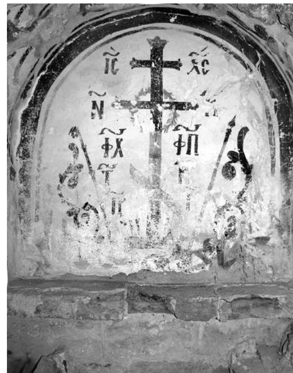
ил. 2 Фреска в жертвеннике церкви Спаса Преображения на Ковалеве близ Новгорода. 1380 г.