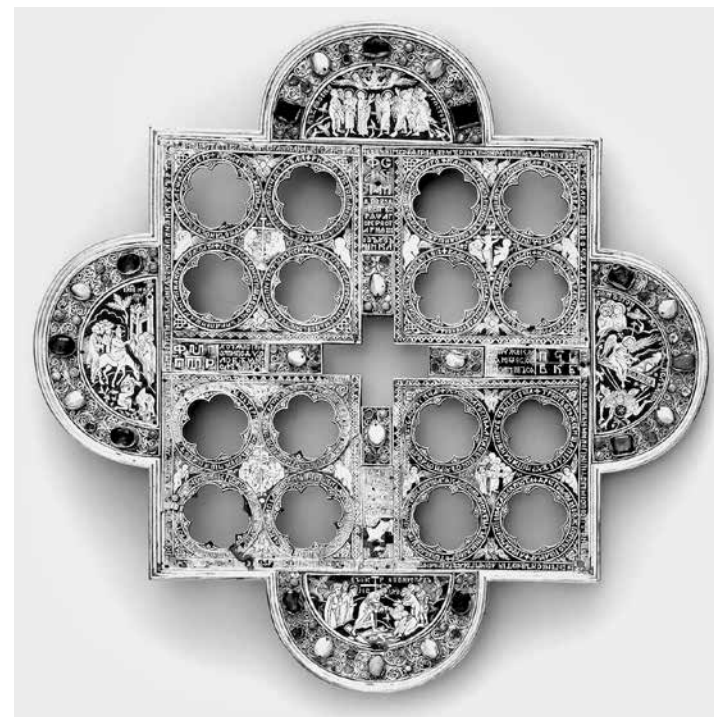
ил.1 Ковчег Дионисия Суздальского. Оклад 1383 г.