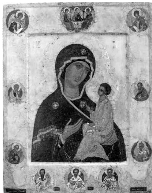
ил. 8 Богоматерь Тихвинская с Троицей Ветхозаветной и святыми на полях. 1526. Москва Из придела Петра и Павла Успенского собора Московского Кремля. ГММК fig. 8 The Tikhvin Mother of God with the Old Testament Trinity and the saints on the margins 1526. Moscow. From the side-altar of Peter and Paul of the Moscow Kremlin Assumption Cathedral. The Moscow Kremlin Museums

Василия III [ПСРЛ. 1929. С. 539–540]. Причины, побудившие возвести в далеком от центра деревянном погосте грандиозный по размерам пятикупольный собор, уподобленный своими формами кремлевским, не вполне ясны; но очевидно, что изначально он задумывался как своеобразный реликварий для хранения чудотворной иконы. Об этом свидетельствует необычное пространственное решение, продиктованное необходимостью расположить святыню в определенном месте — на западной грани юго-западного столпа (подобно тому, как это было во Влахернах, с образом которых Сказание отождествляло «прилетевшую» на «Тихвину» Одигитрию). Этим объясняется широко «расставленное» пятиглавие с сильно сдвинутыми к западу боковыми главами, появившееся для дополнительного освещения компартамента над киотом с иконой; а также большая ширина западного нефа, обеспечивавшего обширное пространство между столпом и западной стеной [Седов, 2001] [ил. 2]. Последнее было предназначено для стояния большого числа людей и богатого обрамления святыни. Поскольку храм возводился по воле Василия III, естественно предполагать, что и убранство чудотворной иконы «устраивалось» великокняжеской казной.