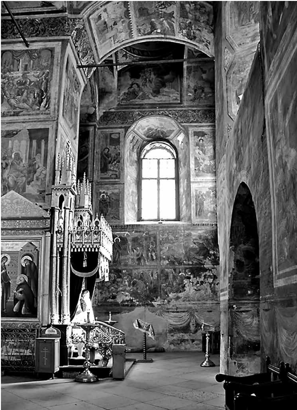
ил. 2 Юго-западный компартимент Успенского собора Тихвинского монастыря. 1515 fig. 2 Southwestern compartment of the Assumption Cathedral of the Tikhvin Monastery. 1515

Введенском монастыре, куда, судя по документам, отдавали в чинку шитые ткани и где со времен живущих там царицы-инокини Дарьи (Колтовской) и ее племянниц находилась мастерская 8 . Первый раз (около 1560) средник был перекошен с древней голубой на черную камку; второй — после 1612 г. на золотный бархат, причем тогда же древние поля с изображениями святых были утрачены и заменены красной каймой; наконец, третий — на коричневый бархат (в таком виде подия поступила в Русский музей). Не исключено, что это произошло в 1765 г., поскольку составленная тогда опись не упоминает ее в соборе.