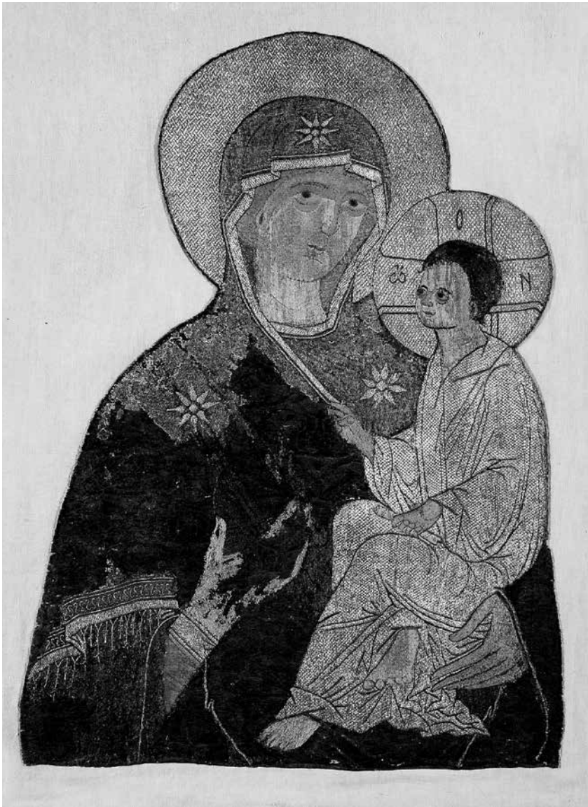
ил. 1 Богоматерь Одигитрия Тихвинская. Шитая пелена. Около 1515. Мастерская Соломонии Сабуровой. Из Успенского собора Тихвинского монастыря. ГРМ

fig. 1 The Tikhvin Mother of God Hodegetria. Embroidered Podea. Around 1515. Workshop of Solomonia Saburova. From the Assumption Cathedral of the Tikhvin Monastery. The State Russian Museum