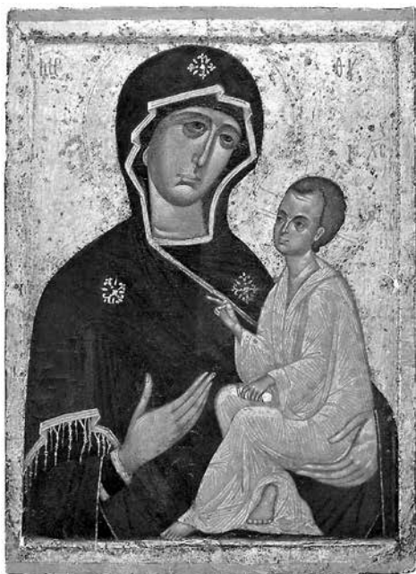
ил. 7 Икона Богоматери Тихвинской. Конец XIV (?) – XV в. Успенский собор Тихвинского монастыря fig. 7 Icon of The Mother of God of Tikhvin. End of the 14 th (?) – 15 th century. Assumption Cathedral of the Tikhvin Monastery