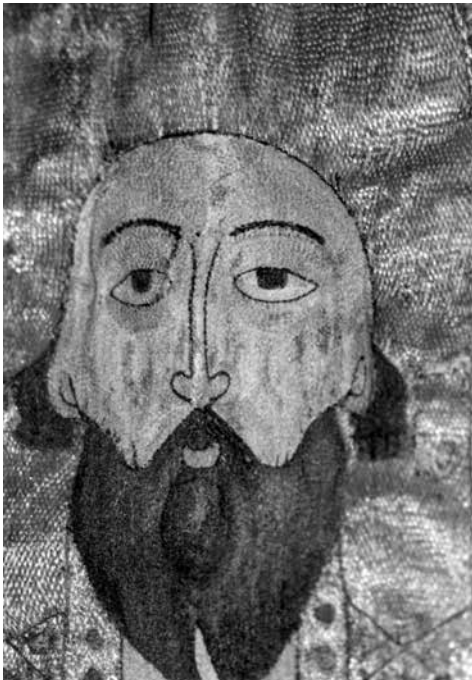
ил. 3 Лик. Фрагмент покрыва «Преподобный Леонтий Ростовский». 1514. Мастерская Соломонии Сабуровой. Из Успенского собора Ростова. ГМЗ «Ростовский Кремль»

fig. 3 The Tomb Pall of Venerable Leonty Rostovsky. Detail (Face). 1514. Workshop of Solomonia Saburova. From the Assumption Cathedral in Rostov. State Museum-Reserve Rostov Kremlin