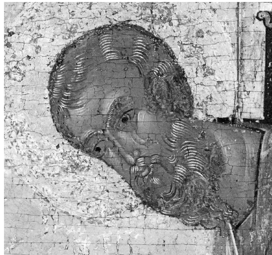
ил. 5 Лик евангелиста Матфея. Деталь Царских врат fig. 5 Face of Matthew the Evangelist. Detail of the Royal Doors

Состав использованных пигментов отличается от палитры рублевских произведений: вместо лазурита использован азурит, а также большое количество малахита, в том числе в смеси с азуритом. Мастера применяли сложные смеси, в составе которых в разной пропорции (иногда в виде незначительной примеси) присутствуют практически все пигменты. Например, зеленый цвет фона и полей составлен из азурита, малахита, свинцовых белил с примесью черного углеродистого пигмента, желтой и красной охры, киновари. Архитектура розового цвета написана смесью свинцового сурика и белил, азурита, малахита с незначительной примесью черного и киновари. Зеленовато-оливковый санкирь в личном письме включает желтую и красную охры, частицы черного и белил, примесь киновари и отдельные частицы азурита. Вохрение составлено из желтой охры, белил и киновари, придающей ликам розовый оттенок.