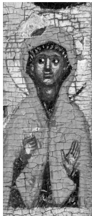
ил. 2 Лик святителя Николая. Деталь иконы «Святитель Николай Чудотворец, с избранными святыми на полях»

fig. 2 Face of Saint Nicholas. Details of the icon "Holy Hierarch Nicholas the Wonderworker, with Selected Saints"