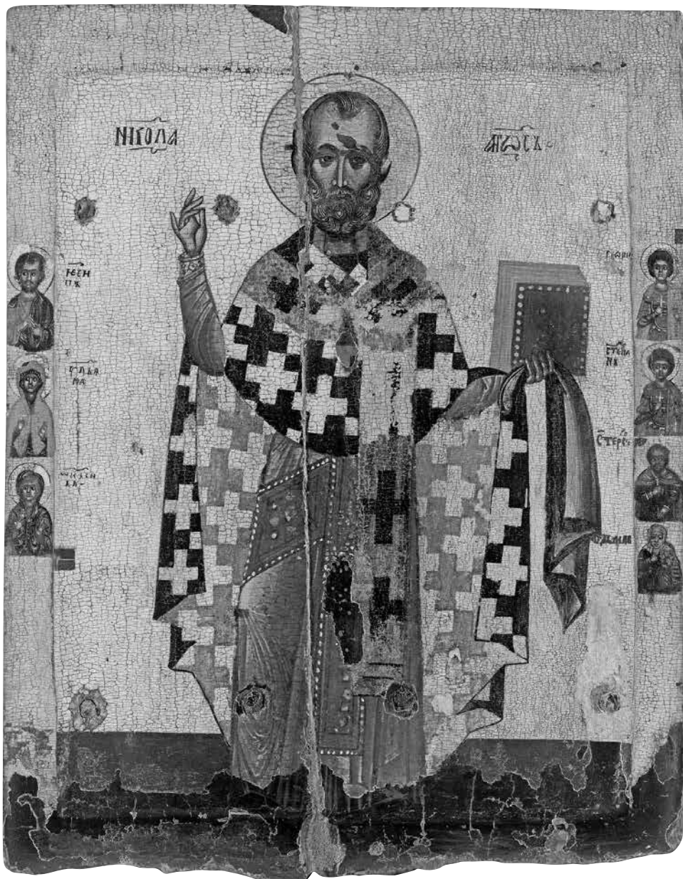
ил. 1 Святитель Николай Чудотворец, с избранными святыми на полях. Новгород (?) Вторая четверть — середина XIV в. Собрание семьи Татинця fig. 1 Holy Hierarch Nicholas the Wonderworker, with Selected Saints in the Margins. Novgorod (?). Second quarter — middle of the 14 th century. Tatintian Family Collection

была сделана И.А. Шалиной 1 . Она уверенно отнесла икону к искусству Великого Новгорода, датировав второй четвертью — серединой XIV в.