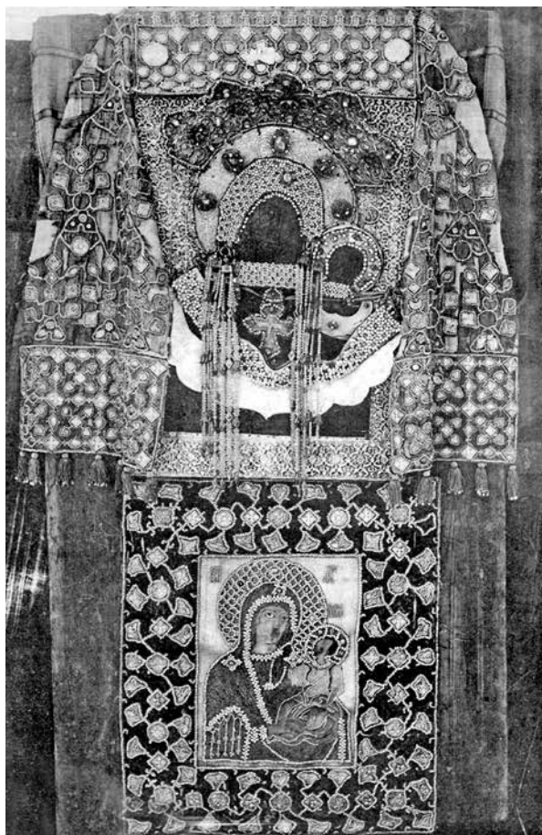
ил.3 Икона Богоматерь Одигитрия (Грузинская) в драгоценном уборе с пеленой и убрусом. Архивное фото, 1910