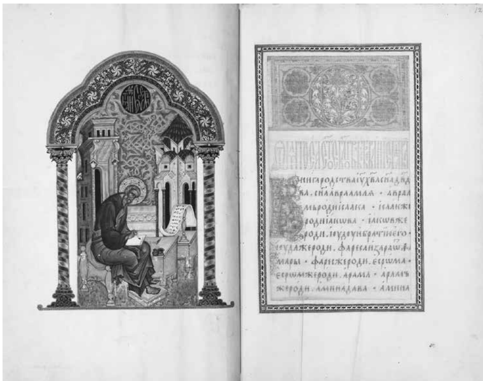
ил. 3 Евангелие тетр (Исаака Бирева). 1531. РГБ, ф. 304/1, №15. Л. 11 об.–12 (По изд.: Евангелие Исаака Бирева, 2019. С. 32–33)