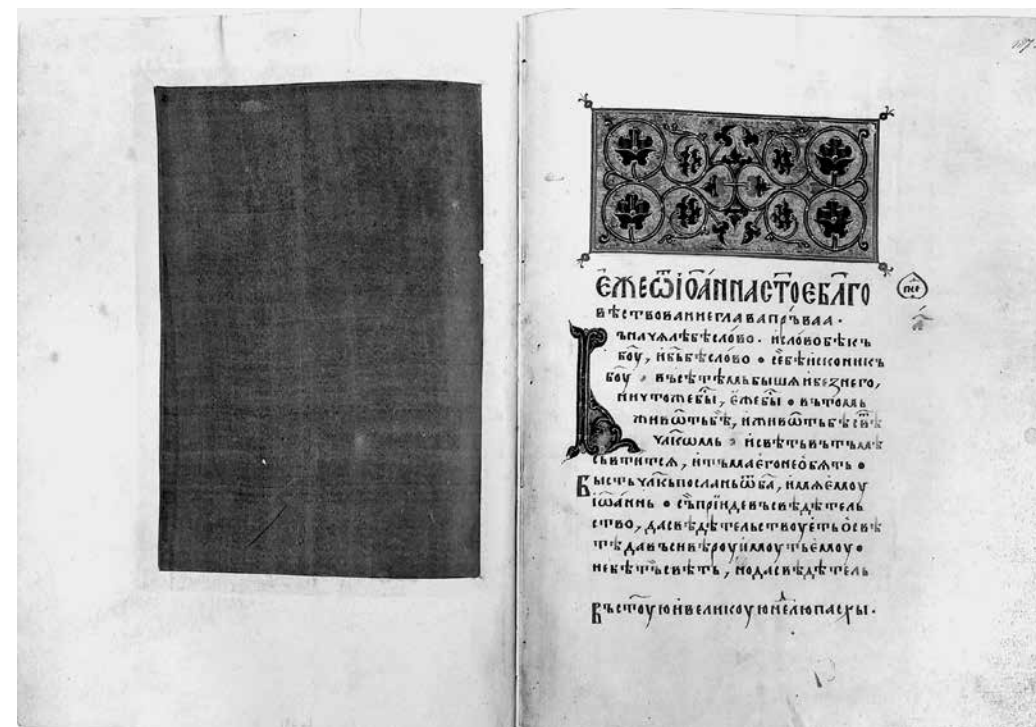
ил. 1 Евангелие тетр. Первая четверть XV в. ГРМ, Др. гр. 9. Л. 186 об.–187 (По изд.: Вздорнов, 1980. Кат. 67)