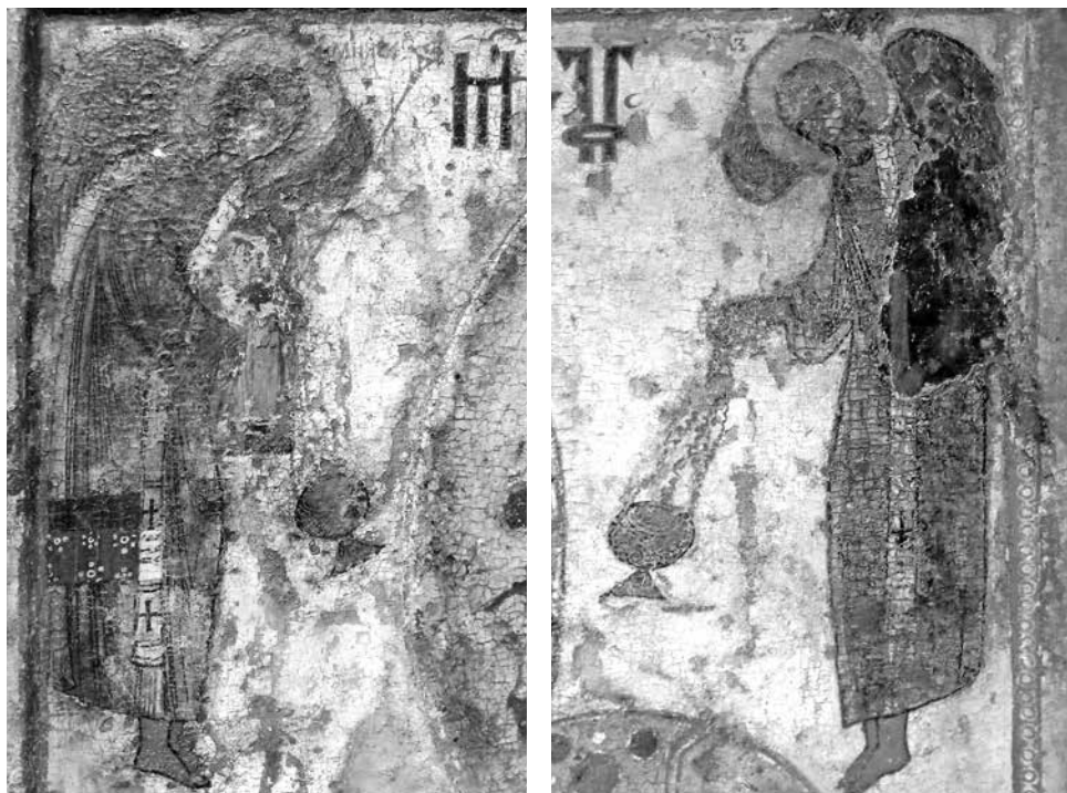
ил.9 Ангелы с кадилами. Деталь иконы. Богоматерь Одигитрия. Около 1313. Псков Из собора Рождества Богородицы Снеготорского монастыря. ПГОИАХМЗ fig.9 Angels with thuribles. Detail of the icon Virgin Hodegetria. Ca. 1313, Pskov From the Nativity of Our Lady Cathedral of Snetogorsky monastery. Pskov Museum-Reserve

Иисуса, даже абрисы мягких изгибающихся складок туники и плаща, вплоть до идентичных разделок тканей. Наконец, близкими чертами отмечена келейная икона Иоанновского монастыря, написанная около 1400 г. [Васильева, 2012. С. 57], несмотря на фронтальное расположение Младенца, передающая все отмеченные приметы композиции. Очевидно, что все дошедшие до нас псковские иконы восходят к какому-то древнему почитаемому богородичному изображению, видимо, издавна прославившемуся в Пскове и имевшему византийские истоки 12 , о чем красноречиво свидетельствует аналогичный образ Одигитрии около 1192 г. из монастыря Аракиотиссы в Лагудера на Кипре (Никосия, Византийский музей) [ил.8] [Sophocleous, 1994. P. 84. Cat. 16. Pl. 141], восходящий к тому же прототипу, что и все эти псковские иконы.