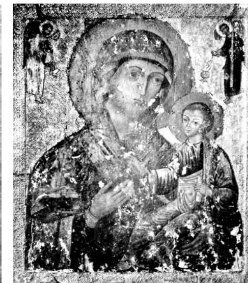
ил. 1 Богоматерь Одигитрия. Икона. Около 1313. Псков. Из собора Рождества Богородицы Снетогорского монастыря. ПГОИАХМЗ

fig. 1 Virgin Hodegetria. Icon. Circa 1313. Pskov. From the Nativity of Holy Virgin Cathedral of the Snetogorsky monastery. Pskov Museum-Reserve