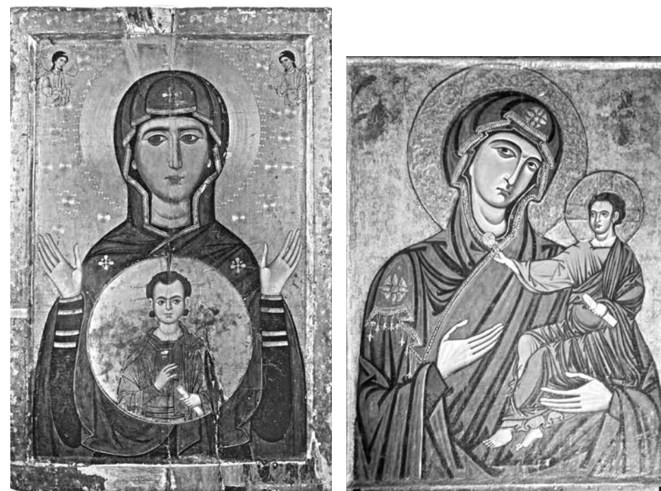
ил.10 Богоматерь Влахернитисса. Икона. Середина XIII в. Монастырь Св. Екатерины. Синай fig.10 Our Lady of Vlahernitissa. Icon. Mid 13 th century. Sinai, monastery of Saint Catherine ил.11 Богоматерь Одигитрия. Икона. Около 1180. Собор в Монреале (Сицилия). fig.11 Hoedegitria Virgin. Icon. Ca. 1180. Monreale Cathedral (Sicily).

разе небесных дьяконов: они облачены в стихари с перекинутыми через плечо орарями и с кадилами в руках, — крайне редким мотивом для богородичных икон [ил.9] . Обычно поклоняющиеся ангелы с молитвенно сложенными руками или жезлами — атрибутами небесной свиты — представляют собой образ небесного служения перед Богородицей, символизирующей Небесный Престол с вознесенным на него Агнцем. Поэтому они часто изображаются в дьяконских одеждах и с покровенными руками, готовыми принять небесную жертву, подобно ангелам на Ярославской Оранте (ок. 1224) [ГТГ. Каталог. 1995. Кат. 15. С. 68–70] со святительскими крещатыми омофорами на плечах; или на иконе Богоматери Белозерской второй четверти XIII в. (ГРМ) [Салько, 1982. Табл. 195–198] в «небесных» белых одеждах, напоминающих стихари. Редкие для древних памятников орудия страстей, акцентирующих жертвенно-евхаристическое содержание, на Руси впервые встречаются в образе второй половины XIII в. из Дмитриевского монастыря в Кашине [Сарабьянов, 1997] с двумя склоненными над головой Марии ангелами, держащими в покровенных руках крест и копье, розги и губку.