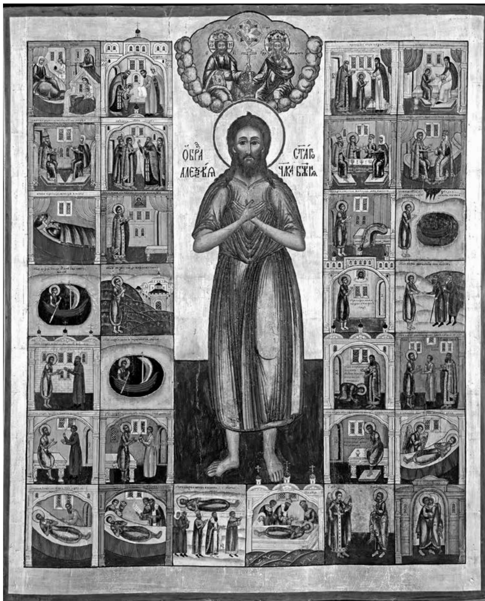
ил.1 Преподобный Алексей человек Божий, с житием Алексея, ангелом-хранителем (?), апостолом Петром и Зачатием Пресвятой Богородицы. Икона. Конец XVII – начало XVIII в. Северное Заволжье. Собрание В.И. Некрасова

fig.1 Venerable Alexis the Man of God with Vita, the Guardian Angel (?), Saint Peter the Apostle, and the Conception of the Virgin Mary by Righteous Anna. Icon. Late 17 th – early 18 th centuries. Made to the North of the Volga River. Vladimir Nekrasov Collection