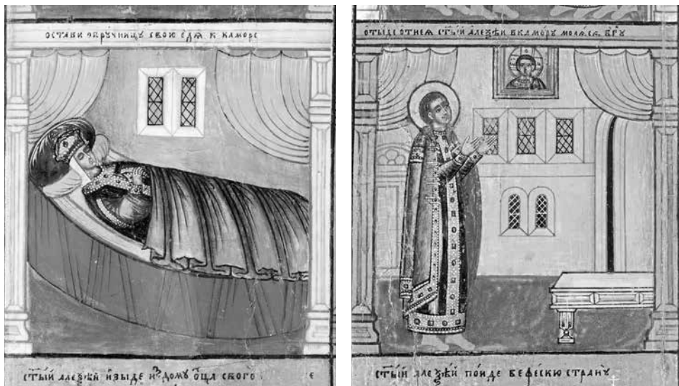
ил. 2,3 Клейма 9, 10: Святой Алексий оставил свою невесту на брачном ложе (2), уйдя в комнату для молитвы Богу (3)