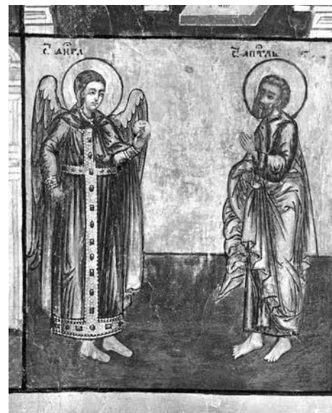
ил. 4 Клеймо 29: Ангел-хранитель (?) и апостол Петр