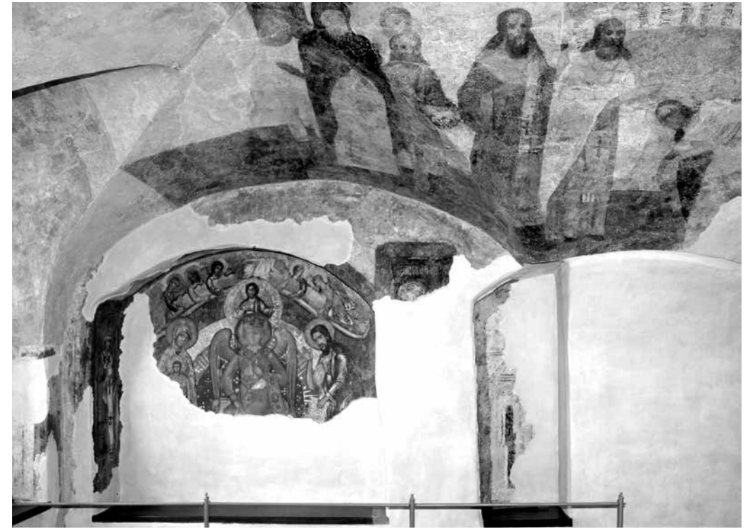
ил. 1 Ниша в восточной стене «кельи Иоанна». Владычная палата, Великий Новгород fig. 1 Niche of the eastern wall in «John's cell». The Episcopical Chamber, Veliky Novgorod

и шапочке, плотно облегающей голову с длинными волосами, а также по надписи, исполненной бордово-красной краской и отчетливо читающейся над его головой — С[В] НИКИТА ЕПИСКОП 2 . Святитель представлен в молитвенном предстоянии Божественной Премудрости. От фигуры на правом откосе ниши сохранился лишь еле различимый край нимба и не поддающиеся прочтению остатки позднейшей надписи, исполненной белилами [ил.3]. От третьего святого, который был изображен, как отмечалось, в простенке между двумя нишами восточной стены, уцелел фрагмент головы с нимбом на таком же сине-голубом фоне, с надписью белилами, на которой в позднейшем слое (XIX в.) значилось: ЕВФИМИЙ АРХИЕ[пископ], тогда как после раскрытия на нижележащем слое читается: ПРПБНЫЙ ЕВФИМИЙ ВЕ... При этом видно, что голова святого несколько смещена в сторону левой ниши, — следовательно, он был также представлен в трехчетвертном повороте к образу Софии Премудрости. О том, что голова была слегка склонена, свидетельствует рисунок уцелевшей графы, соответствующей изображению креста в лобной части клобука. Сама