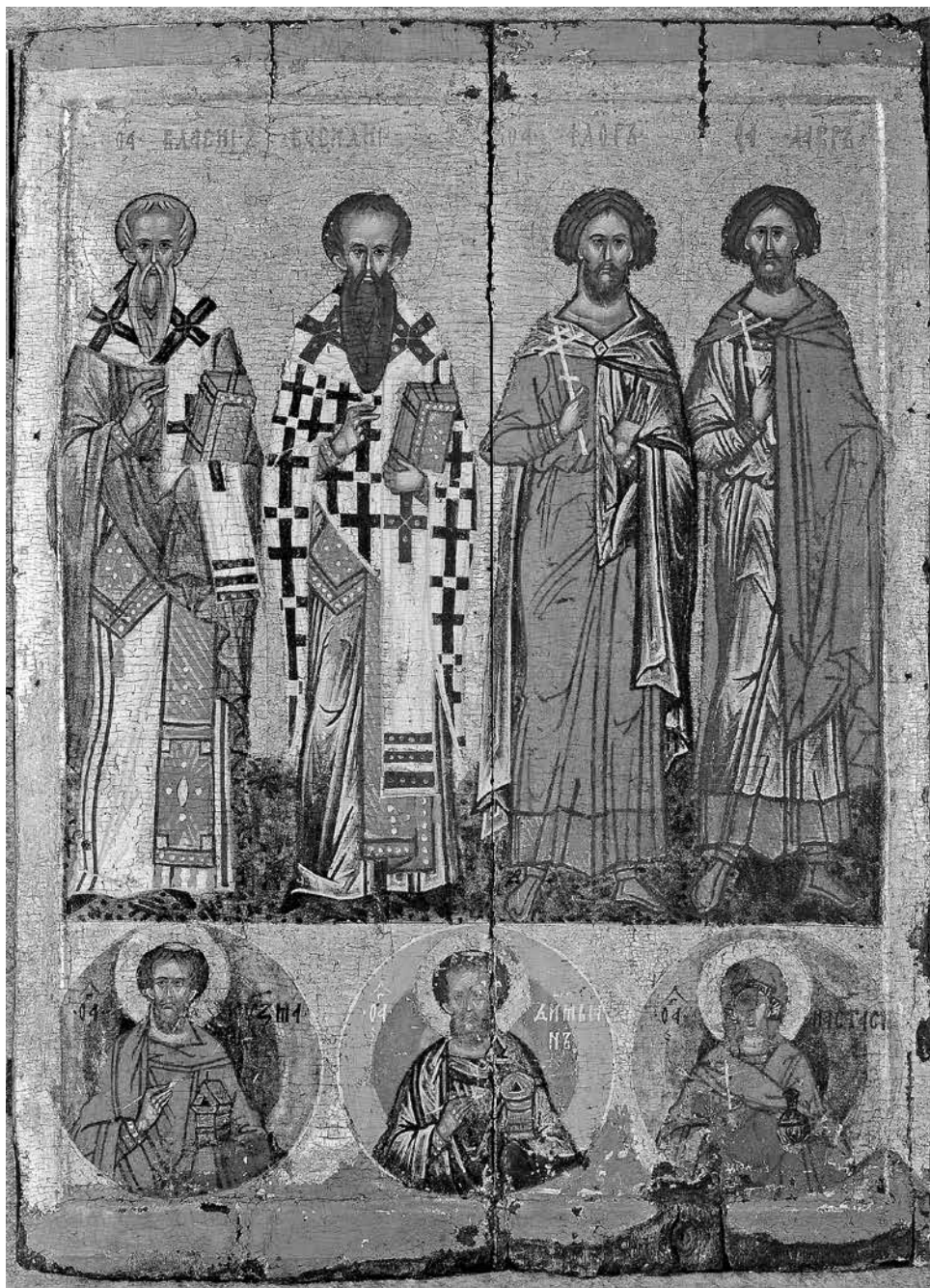
ил. 1 Избранные святые. Новгородская икона. Третья четверть XV в. Собрание Н.В. Шутова, Москва

fig. 1 Selected saints. Novgorod Icon. Third quarter of 15 th century From the collection of V. Shutov, Moscow