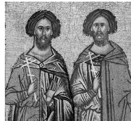
ил. 5 Св. Флор и Лавр. Деталь иконы «Избранные святые». Собрание Н.В. Шутова, Москва fig.5 Saints Florus and Laurus. Detail of the icon Selected Saints . From the collection of N.V. Shutov. Moscow

fig.4 Saint Cosmas. Details of the lower tier of the icon Selected Saints From the collection of N.V. Shutov. Moscow