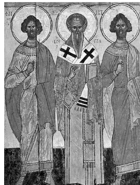
fig. 1 Selected saints. Novgorod Icon. Third quarter of 15 th century From the collection of V. Shutov, Moscow