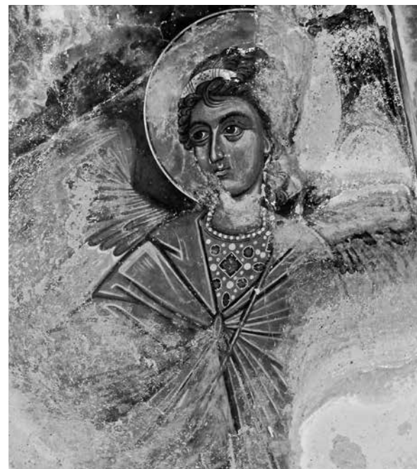
ил.6 Богоматерь на троне. Роспись конхи алтаря храма Рождества Богоматери. 1280–1290-е. Деталь fig.6 The Virgin Enthroned. Fresco of the altar apse in the Nativity of Our Lady church 1280–1290s. Details