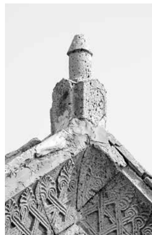
ил.3 Храм Рождества Богоматери. Последняя четверть XIII в. Южный фасад fig.3 Nativity of Our Lady church. Last quarter of 13 th century. South elevation