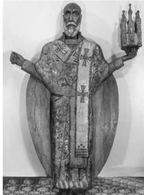
ил.4 Свт. Николай Чудотворец. Резная икона. Новгород. 1540–1542 (?). ГРМ. Доличная резьба. Роспись. В процессе укрепления