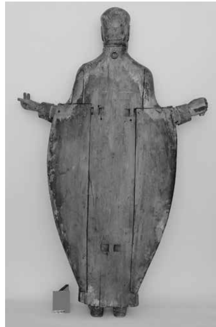
fig.3 Nicholas the Wonderworker. Carved icon Novgorod. 1540–1542 (?). State Russian Museum Execution of the face