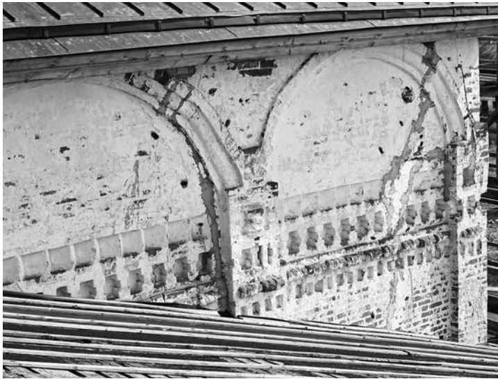
ил. 8 Воскресенский собор Горицкого монастыря. Западный фасад. Фрагмент. fig. 8 Resurrection Cathedral of the Goritsky monastery. West facade. Fragment.

Если допустить подобную интерпретацию мотивов, то мы должны признать, что собор Горицкого монастыря начали строить после 1561 (освящение собора Покрова на Рву) или после 1559 г. (освящение его приделов). Подобная датировка не противоречит и применению повышено-подпружных арок, которые встречаются в постройках второй половины столетия. Так, они использованы в соборе Анастасийского Богоявленского монастыря в Костроме 1559–1563/1564 гг., также обладающего архаизированными чертами средне-русской архитектуры (в том числе и фризом, аналогичным фризу барабана в соборе Покровского Суздальского монастыря).