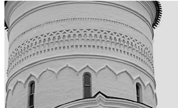
ил. 6 Собор Спасо-Прилуцкого монастыря. Барабан. Фрагмент фриза. fig.6 The Cathedral of the Savior Prilutsk Monastery. Drum. Fragment of a frieze.

Кремля и более позднему Воскресенскому собору Волоколамска. В этих храмах баясины располагались или между нижним и верхним городками как в церкви Ризоположения, или под верхним рядом городков и опирались на полку (в Духовской церкви Троице-Сергиева монастыря и соборе Волоколамска). Существовал и другой принцип размещения баясин в нишах, созданных тягами, соединяющими или два городка, или верхний городок с полкой (дворец князя Андрея Васильевича Углицкого). Особенностью соборов Белозерья конца XV в. было преимущественное размещение керамических баясин в крестообразных нишах (соборы Спас-Каменного, Ферапонтова и Кирилло-Белозерского монастырей) [ил.4]. Исключение составляет фриз на апсиде жертвенника Успенского собора Кирилло-Белозерского монастыря.