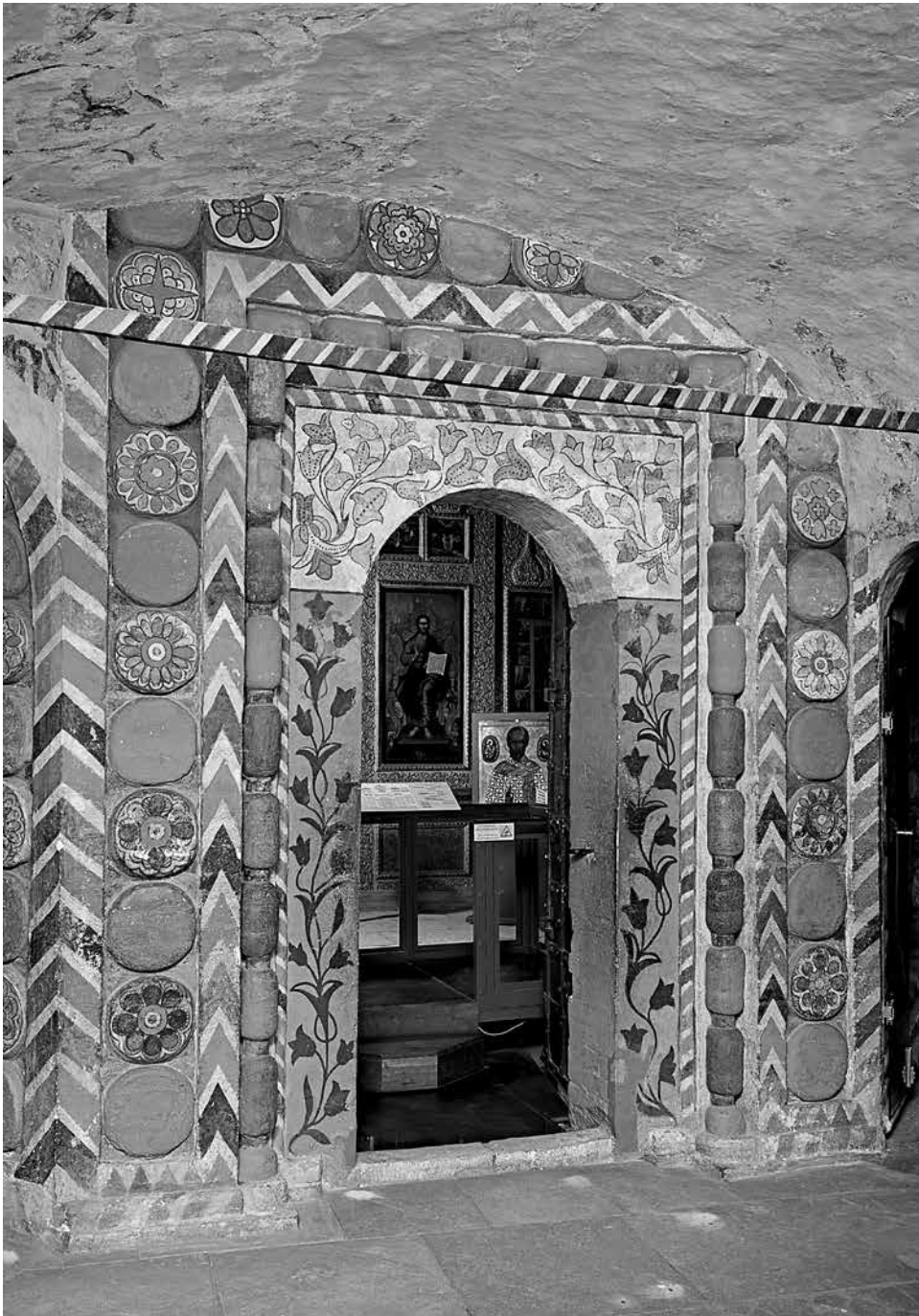
ил. 7 Собор Покрова на Рву. Портал придела Николая Великорецкого fig.7 Cathedral of the Intercession of the Most Holy Theotokos on the Moat. The portal of the Nikola Velikoretsky chapel