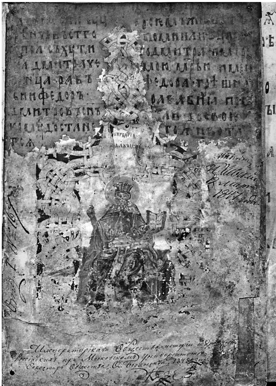
ил.4 Запись писца Фёдора и миниатюра с изображением пророка Давида. Псалтирь. Конец XIV в. РГБ. Ф. 205. №167. Л. 1. Фигура пророка исполнена в XVII–XVIII вв.

fig.4 Inscription of the scribe Fyodor and a miniature with the image of David the Prophet. Psalter. Late 14 th century. Russian State Library. F.205. No.167. L.1. The figure of the prophet was added in 17 th –18 th century