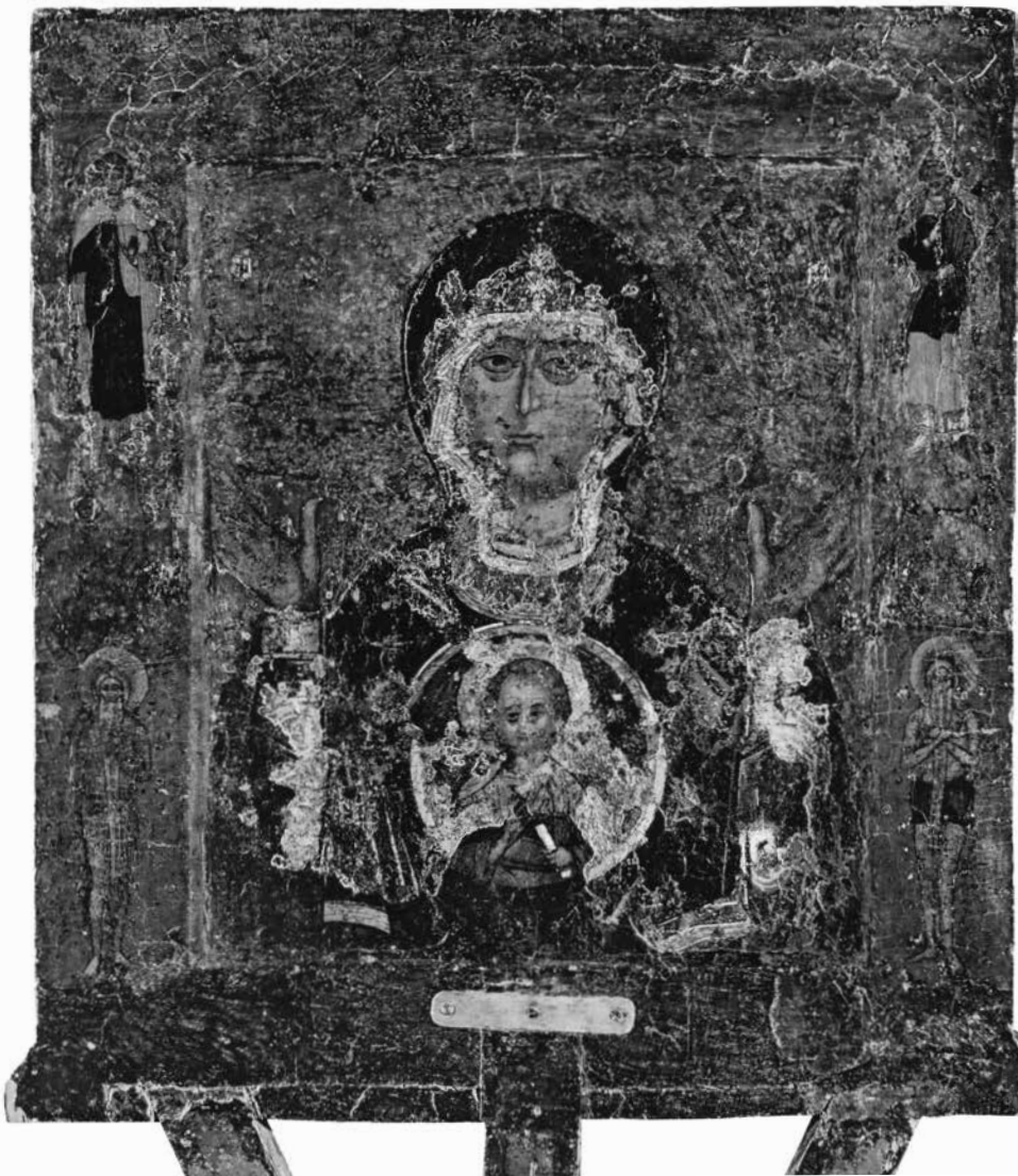
ил.1 Богоматерь Знамение. Икона. XII в. Софийский собор в Новгороде fig.1 Our Lady of the Sign. Icon, 12 th century. The Cathedral of St. Sophia in Novgorod

М.Б. Плюханова Покров и Знамение в Новгороде и Пскове в XIV веке